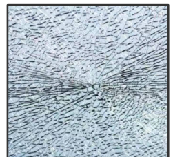
飛散防止ガラス破損状態